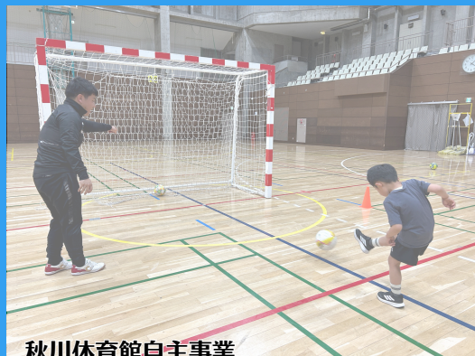
秋川体育館自主事業